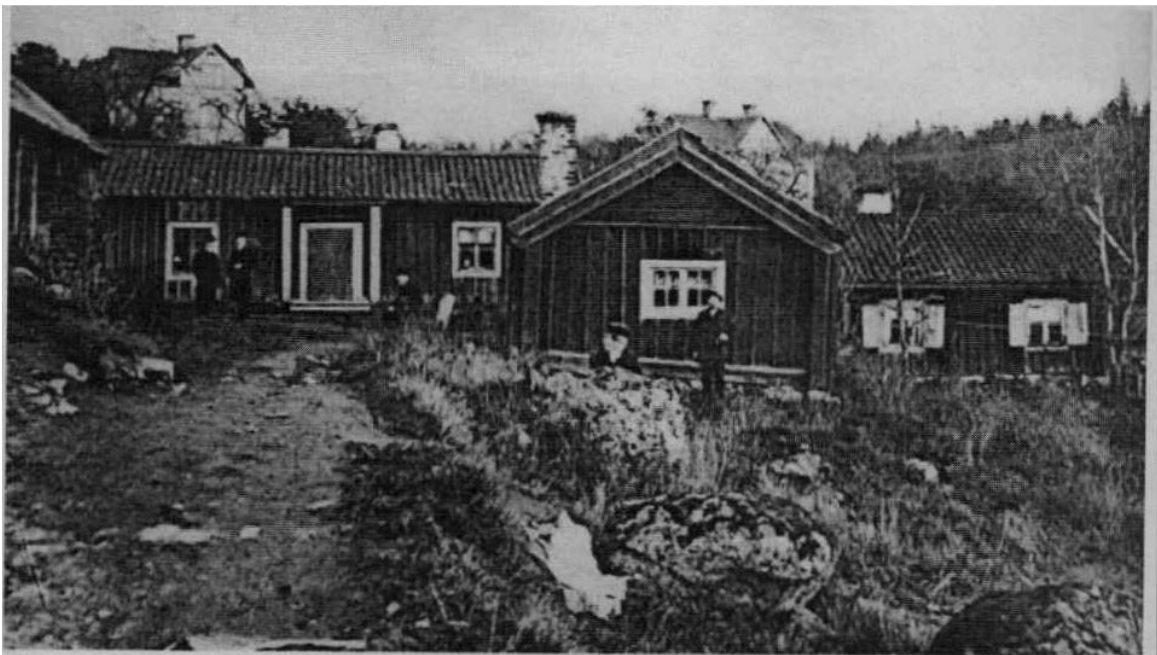
Skjutstationen vid den gamla gårdens Tumba Brink upprättades i samband med järnvägens fram- dragande år 1860. Byggnaden revs år 1908.