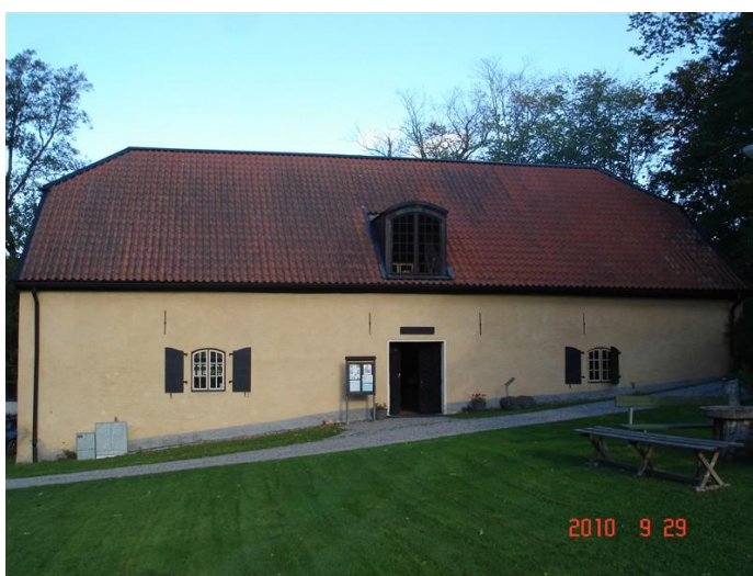
Ingången till Bruksmuseet

Klockan 13 startar visningen av brukets arkiv och museum.