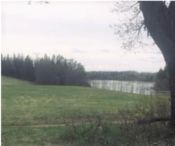
Vy över skogssjön från torpet