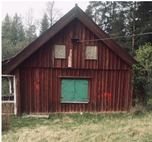
Torpet från öster

År 1787 övertogs torpet av torparen Lars Nilsson född 1760 Grödinge, död 27/2 1797 Botkyrka och hans hustru Greta Andersdotter född 1761 Grödinge, död 22/11 1787 Botkyrka (Barnsäng) . De hade en son Lars född 9/11 1787 död vid förlossningen och nöddöpt. Efter Gretas död gifte Lars om sig med Anna Maria Ersdotter född 1760 Öster Haninge, död 12/10 1798 Botkyrka . Bröllopet skedde den 26/6 1788 Botkyrka . Lars drunknade den 27/2 1797 i Farstasjön.