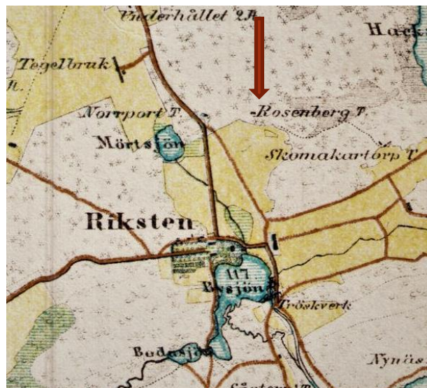
Karta: Lantmäteriet Rikstens fideikommiss