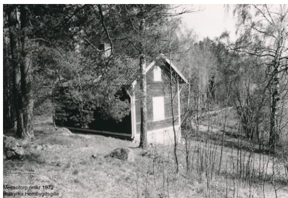
Mellantorp omkr 1972 Botkyrka Hembygds-gille

GPS-position N 59°11'31,13 E 17°51'33,38