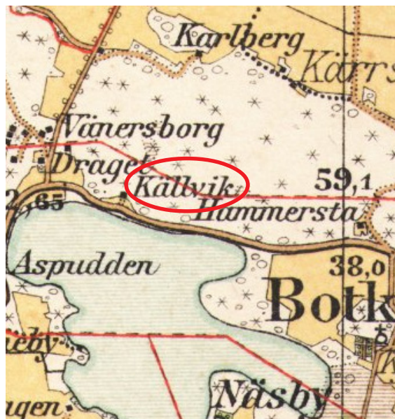
karta från 1906, torpet Källvik