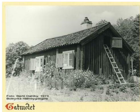
Foto: Bertil Dahlby, 1973 Botkyrka Hembygdsförening Gatmötet Källa: Botkyrka Hembygdsförening Foto: Bertil Dahlby