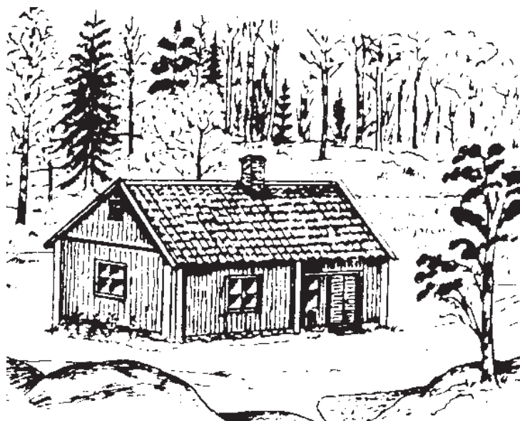
Hamra båtsmanstorp. Teckning av Georg Malmkvist.

(Källa: Botkyrka Kulturmiljöinventering. Tryckt 1988).