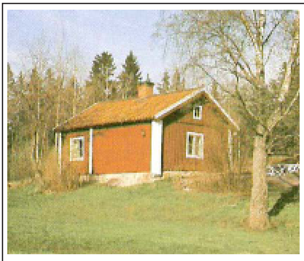
Hamra båtsmanstorp nr 98. Botkyrka Hembygds gilles arkiv. Foto: Bertil Dahlby

Båtsmanstorp från 1710, avsett för båtsman nr 98 i Första Södermanlands Båtsmanskompani.