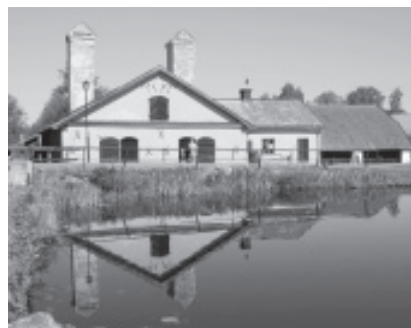
Vallonsmedjan i Österbybruk

Många av vallonkontrakten finns över-satta och transkriberade och säljs på CD eller USB av Sällskapet Vallonättingarna. Originalen finns i Riksarkivet.