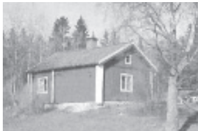
Hamra BT.