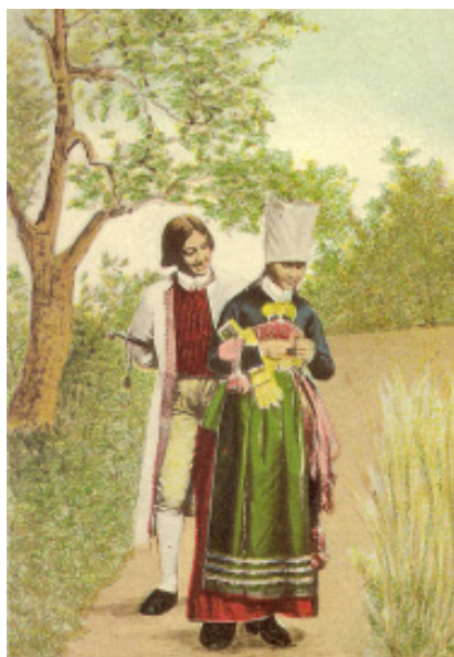
Kvinn- och mansdräkter från Vingåker

Tröjorna fortsatte att vara midjekorta och kragarna var antingen ståndkrage eller krage med slag. Under 1830-1840-talet blev det modernt med många blanka