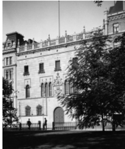
Hallwylska Palatset, början 1900-talet.

Vi var nio personer som träffades vid muséet kl. 17. En mycket duktig guide visade oss runt i palatsets våningar. Wilhelmina och Walther von Hallwyl lät bygga huset 1893-98. Arkitekt var Isak Gustaf Clason. Bygget kostade 1,5 miljoner kronor. Huset är inrett dels i 1600- och 1700-talsstil dels i modernare jugendstil. Wilhelmina ville att huset och alla inventarier skulle bli ett museum, för att belysa både hennes egen samtids och äldre tiders kultur. Hon samlade föremål hela sitt liv. Hon köpte antikviteter och