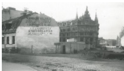
Hamngatan 4-6 omkring år 1890.

Vi var nio personer som träffades vid muséet kl. 17. En mycket duktig guide visade oss runt i palatsets våningar. Wilhelmina och Walther von Hallwyl lät bygga huset 1893-98. Arkitekt var Isak Gustaf Clason. Bygget kostade 1,5 miljoner kronor. Huset är inrett dels i 1600- och 1700-talsstil dels i modernare jugendstil. Wilhelmina ville att huset och alla inventarier skulle bli ett museum, för att belysa både hennes egen samtids och äldre tiders kultur. Hon samlade föremål hela sitt liv. Hon köpte antikviteter och