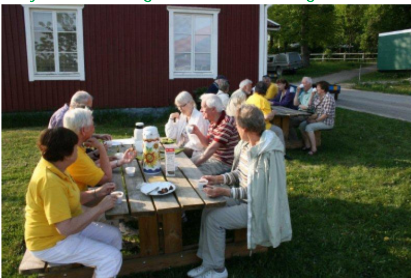
Ett 15-tal deltagare hade hörammat inbudan till den guideade utflykten vid Balingsta Kvarn.