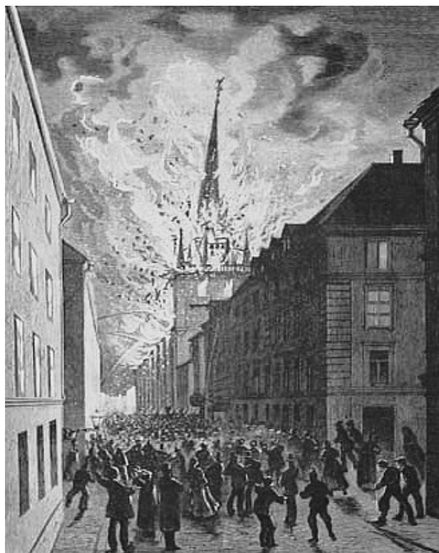
Tyska kyrkan brinner 1878.