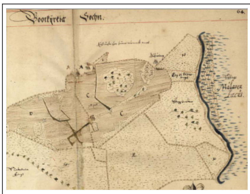
Karta från 1636 över Botkyrka socken från Riksarkivet