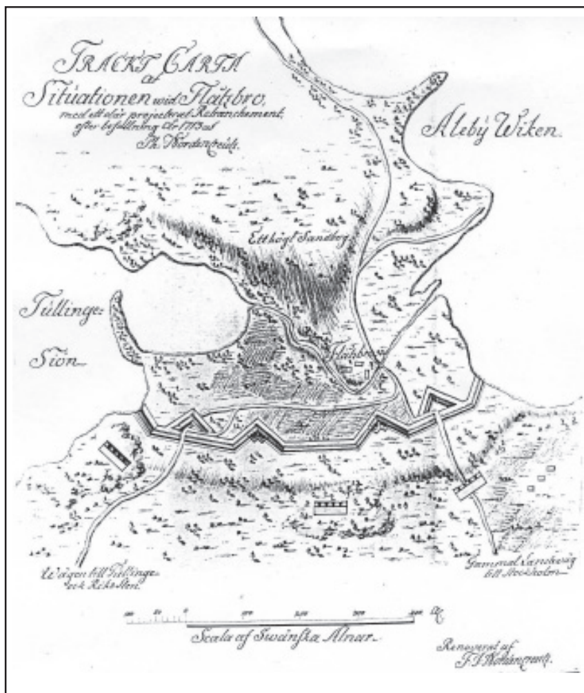
Kartskiss över Flottsbro daterad 1713