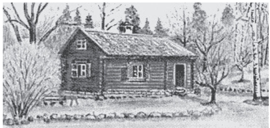
Torpet Trädgårdstorp i Tullinge