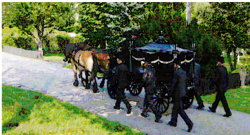
Sveriges Dödbok 5 ska omfatta tiden från 1901 och ska vara klar till Släktforskardagarna i Örebro. Bilden: Begravningsvagn från slutet av 1800-talet. Öja församling i Småland.

nästa 30 år gammalt. En inmatningsmodul har byggts på "baksidan" av Rötter för registrering av uppgifter. Till varje uppgift ska originalblanketten och bilden scannas. Allt kommer senare att läggas in i en ny sökbar databas och tillgängliggörs på Rötter. Och sedan är det meningen att gravstensinventeraren själv registrerar gravstenarna i databasen.