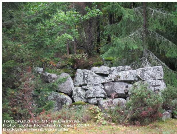
Torpgrund vid Stora Bastnäs Foto: Lotta Nordholm, sept 2011 Botkyrka Hembygdsgrupp Torpgrunden St. Bastmora. Foto Lotta Nordholm