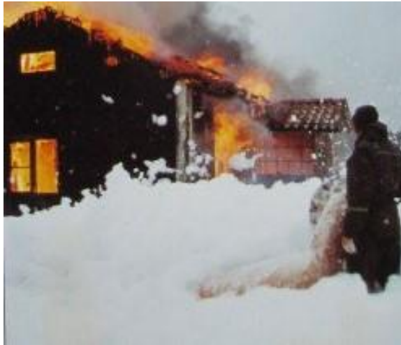
Torpet Spåntorp brändes ned år 1977 av F18:s brandkår.