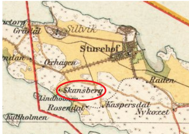
Källa: Lantmäteriet, karta från 1906, torpet Skansberg

HFL AI:2+3+4+5+6+7+8+9 (1760-69-81-90-99-1805-10-15.20) sid. 179, 197, 209, 212, 228, 255, 239, 268