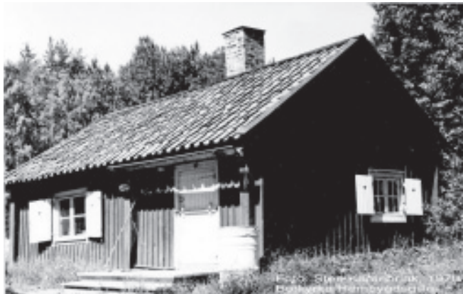
Torpet Skansberg 1970.