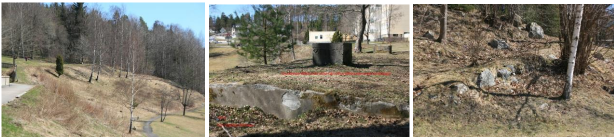
våren 2014