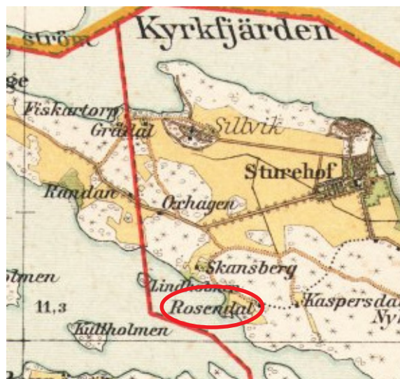
Källa: Lantmäteriet, karta från 1906, torpet Rosendal