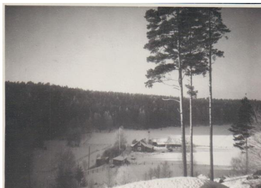
ca 1920 ca 1947