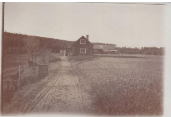
1920 Fler bilder finns på sista sidan.

Ladan flyttades någon gång på 60-talet till Trädgårdstorp i Tullinge.