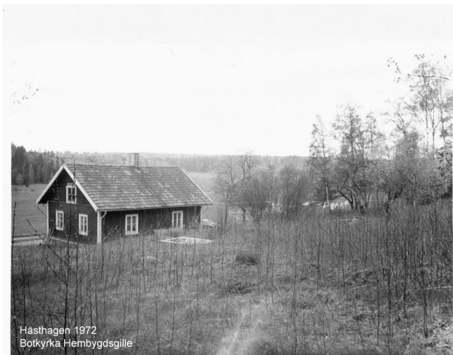
Torpet Hästhagen år 1972