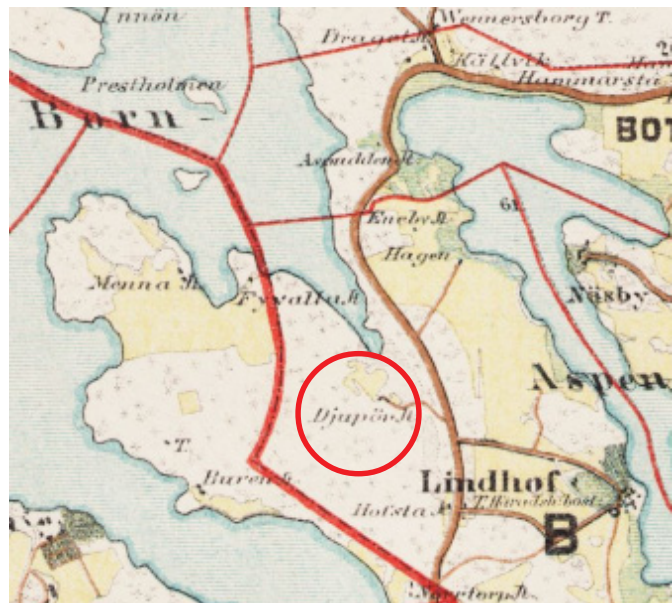
karta från 1869, torpet Djupviken