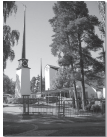
Templet i Västerhaninge, Stockholm

I Sveriges finns 36 släktforskarcenter som har datorer med olika sök- och betalprogram installerade. Tidigare använde man mikrofilmrullar som kom från Utah, men numera är det de digitaliserade filmerna man tittar på i datorerna. I Sverige arbetar fem amerikaner för närva-