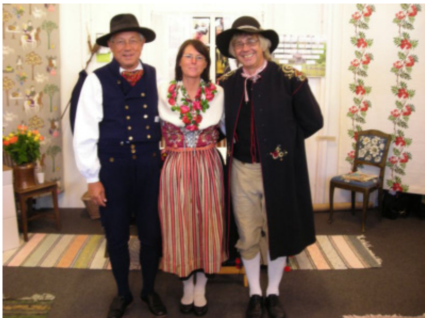
Personal från Släktforskarnas hus i Leksand.