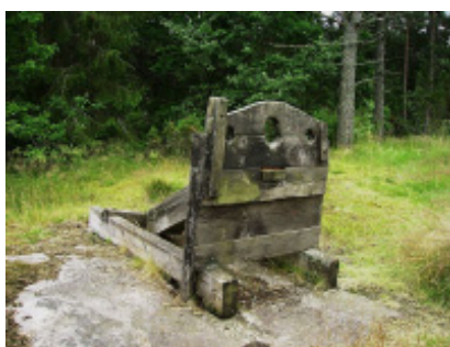
Skamstock vid Skottvångs gruva i Södermanland.

Alla domar med horsbrott skulle pliktas i kyrkan. De skyldigas namn meddelades under gudstjänsten, och de skyldiga skulle bekänna sina synder. Inne i kyrkan fanns en särskild pliktball, den s.k. horpallen, som de syndande fick stå på under gudstjänsten.