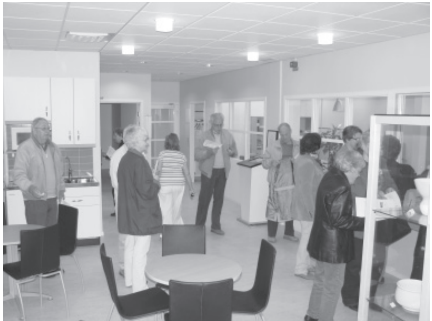
Interiörbild från BSF:s studiebesök på Landstingsarkivet i Flemingsberg.

För att se en utförligare beskrivning vad vi har se vår hemsida.